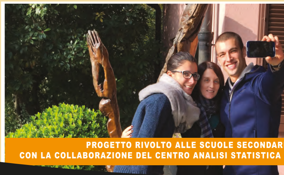
PROGETTO RIVOLTO ALLE SCUOLE SECONDARIE DI I E II GRADO, CON LA COLLABORAZIONE DEL CENTRO ANALISI STATISTICA - UNIVERSITÀ BICOCCA DI MILANO

Per info: semidimelo@gmail.com tel. 02 21015302 — 0382 3814490 www.exodus.it—www.cdg.it