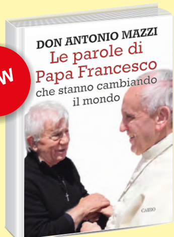
LE PAROLE DI PAPA FRANCESCO che stanno cambiando il mondo di don Antonio Mazzi Cairo Editore

13 marzo 2013. Jorge Mario Bergoglio, arcivescovo di Buenos Aires, diventa Papa Francesco e da quel giorno il volto della Chiesa è cambiato.